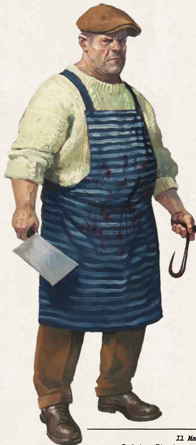
Il Macellaio Rodzina Pizzino – Doradca

Jeśli talia Zleceń się wyczerpie, przetasujcie stos odrzuconych Zleceń, by utworzyć nową talię. Jeśli nie ma stosu kart odrzuconych, nie można dobierać Zleceń.