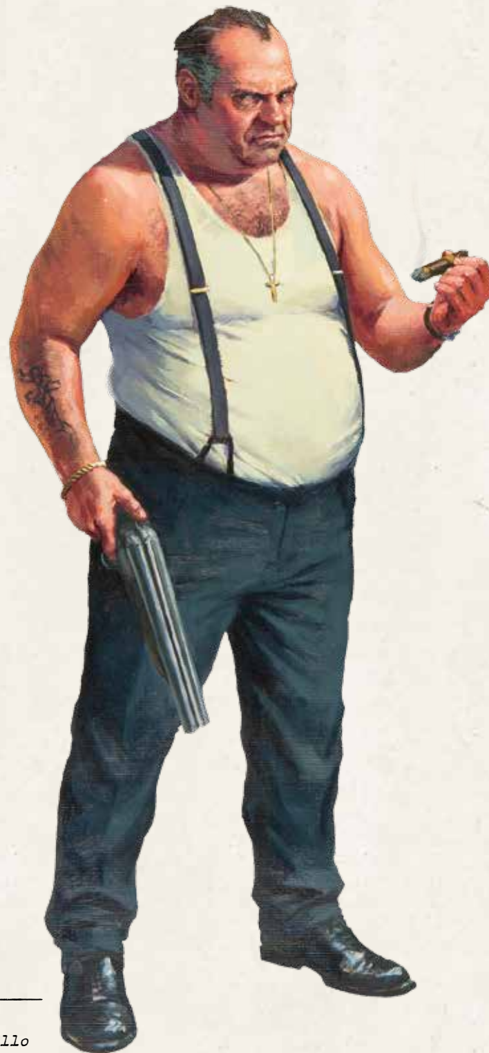
Don Marzullo Rodzina Marzullo

Kiedy nikt z graczy nie przekracza już limitu kart na ręce, bieżący Akt dobiega końca. Jeśli jest to Akt IV, gracze muszą policzyć swoje premie na koniec gry, aby ustalić zwycięzcę (zob. str. 23). W innym przypadku gracze przechodzą do etapu Antraktu, a następnie rozpoczyna się nowy Akt.