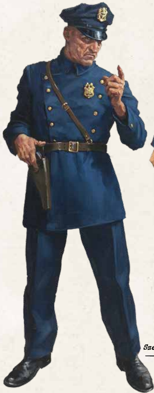
Szefowa Działu Dowodowego