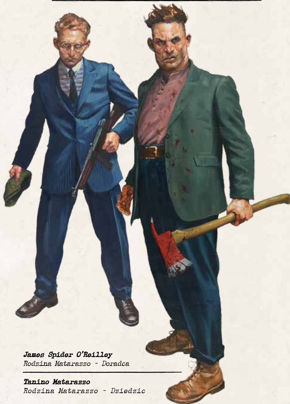
James Spider O'Reilley Rodzina Matarazzo - Doradca

'Hej, Mickey, jutro zbierzesz paru chłopaków i pojedziecie do mieszkania Luki; poczekacie, aż się pojawi...' - Sonny Corleone